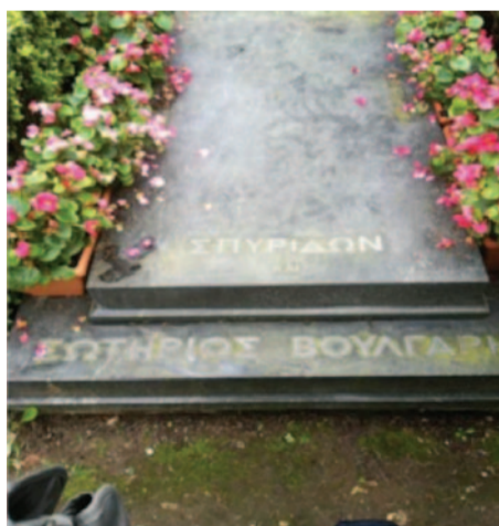
Ο στάφος της οικογένειας Βούλγαρη

Με την ιστορική κωμόπολη της Ηπείρου, την Παραμυθιά Θεσπρωτίας, που υπήρξε, κατά τα χρόνια της τουρκοκρατίας, αξιόλογο, πνευματικό, κέντρο, και απόλαυσε άφθονους τους καρπούς της ευεργεσίας από μικρούς και μεγάλους ευεργέτες, συνδέεται η οικογένεια Μαρούτσι που έπαιξε πρωταγωνιστικό ρόλο στην Ελληνική Κοινότητα της