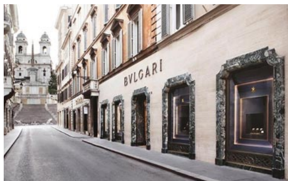
Ο οίκος "BVLGARI" στην Ρώμη»