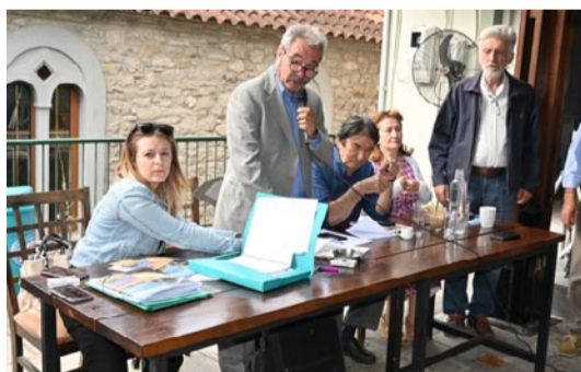
Η Γραμματεία της Συνδιάσκεψης

Και τόσα άλλα μικρά και μεγάλα στα οποία η Ομοσπονδία και τα μέλη της, με τη συμπαράσταση της Πανηπειρωτικής Συνομοσπονδίας Ελλάδας, έχουν βρεθεί μπροστά.