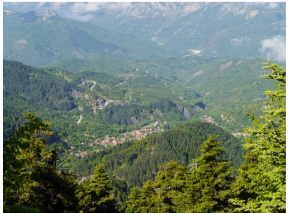
Τα Τζουμερκιώτικα χωριά. Τοπίο απίστευτης ομορφιάς.

Επισημαίνει πως έχουν ωριμάσει πλέον οι συνθήκες για τον εμπλουτισμό του τουριστικού προϊόντος και την ισχυροποίηση του brand name του προορισμού "Τζουμέρκα", ως ενιαία γεωγραφική έκφραση, μέσω της σύνθεσης και της δημιουργικής ανάμιξης των συγκριτικών πλεονεκτημάτων των Βορειών και των Κεντρικών Τζουμερκων. Στο πλαίσιο αυτής της αναγκαιότητας, αναδεικνύει τα προβλήματα και τις δυσκολίες που ανακύπτουν από τη λανθασμένη διοικητική δομή και τη γεωγραφική κατανομή των δήμων.