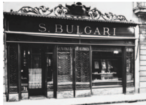
Σωτήρης Βούλγαρης, ο δημιουργός του οίκου "BULGARI"