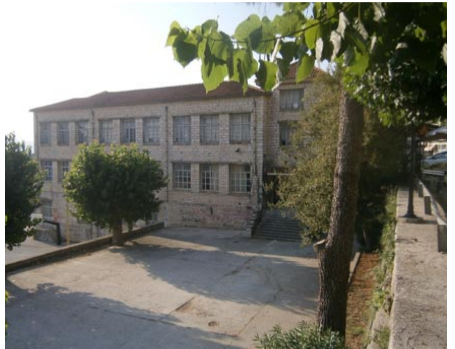
Το κτήριο δωρεάς του οίκου «Βούλγαρη» που λειτούργησε 1938-2009 Δημοτικό Σχολείο