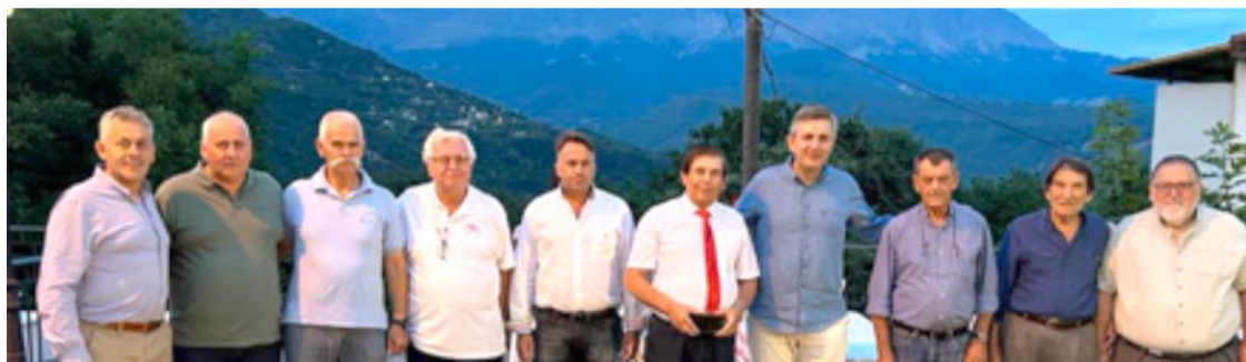
Μια αναμνηστική φωτογραφία

Το πανέμορφο και ορεινό και καιρό της Δαφνωτής, υποδέχθηκε 9 Αυγούστου 2023 το 3ο Αντάμωμα Ετεροδημοτών, με τη μεγάλη συμμετοχή του κόσμου να επιβεβαιώνει για άλλη μια φορά την επιλογή της Δημοτικής Αρχής να διοργανώνει κάθε χρόνο ένα κάλεσμα προς τιμήν των απανταχού ετεροδημοτών μας.