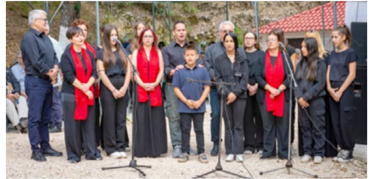
Σύλλογος Πωγωνίου Πολυφωνικού Τραγουδιού