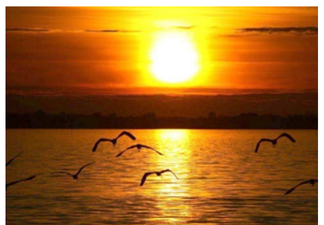
Από τον σταυραετό του Πίνδου, στα δελφίνια και τα νοντοπόρα χέλια του Αμβρακικού