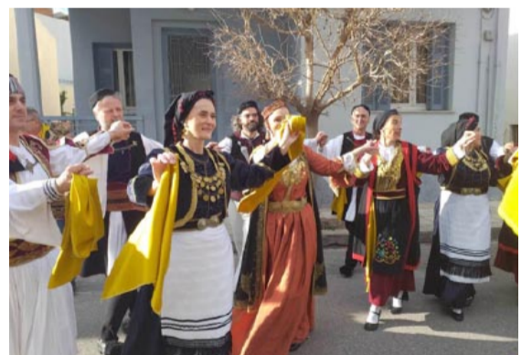
«Γέμισαν οι δρόμοι της Ελευσίνας Ήπειρο»