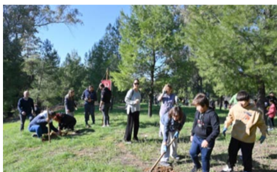
Περιβαλλοντική εκπαίδευση-βιωματική μάθηση