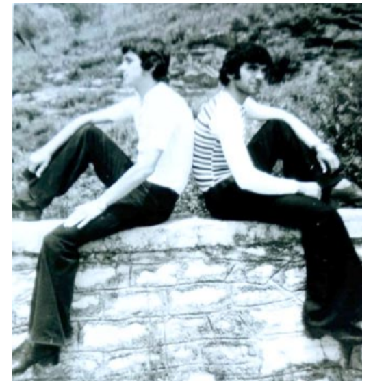
Παντελόνι «Καμπάνα». Καταξίωση

Με τον ξύλινο πήχη στα χέρια, τη μεζούρα τυλιγμένη στο