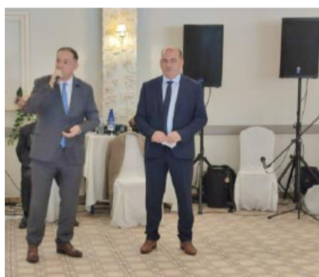
Ο πρόεδρος της Π.Σ.Ε. στον χαιρετισμό του τόνισε τις «προσπάθειες και τους αγώνες της Π.Σ.Ε. για μια καλύτερη Ήπειρο και μια ζωντανή αποδημία του Ηπειρώτικου στοιχείου»