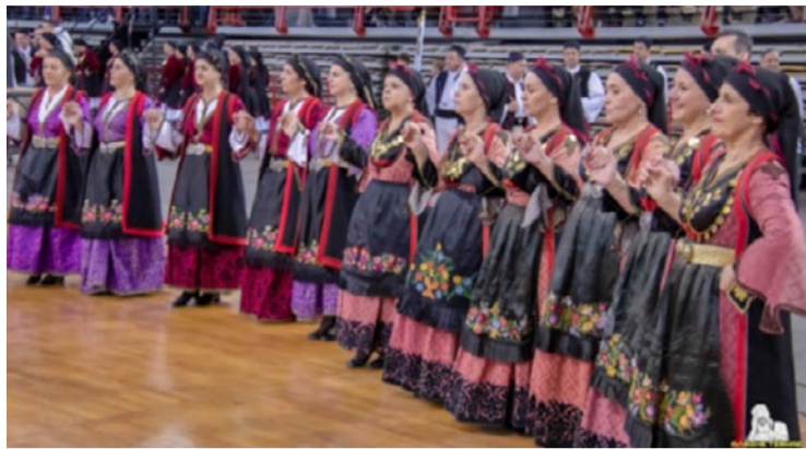
«Η Ήπειρος που κρατάει στον κόρφο της μια απίστευτη και μοναδική παράδοση, σμιλεμένη - χρόνια τώρα - με καημό, περισκεψη και πίστη στον άνθρωπο» · Όλα αυτά αποτυπώνονται στην «Πίτα του Ηπειρώτη»

Η Πανηπειρωτική Συνομοσπονδία Ελλάδας (ΠΣΕ), και φέτος τηρώντας την σαραντάχρονη και πλέον συνέχεια, οργάνωσε στο Στάδιο Ειρήνης και Φιλίας την «Πίτα του Ηπειρώτη 2023». Η εκδήλωση πραγματοποιήθηκε στον συγκεκριμένο χώρο ύστερα από δύο ολόκληρα χρόνια διακοπής, που έγινε στο Πνευματικό Κέντρο Ηπειρωτών (Κλεισθένους 15) υπό συνθήκες πανδημίας, λόγω κορωνοϊού.