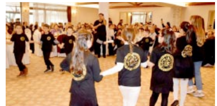
Κυριάρχησαν χορευτικά τα παιδικά τμήματα

καθώς και τη φιλοξενία του στο site ROMIANEWS .