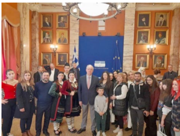
Θερμή ήταν η υποδοχή του Προέδρου της Βουλής Κώστα Τασούλα