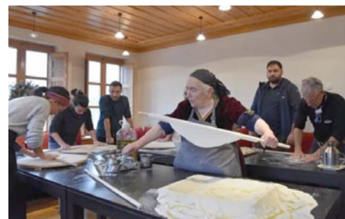
Η τέχνη της πίτας. Πρακτική εφαρμογή της διδασκαλίας

Το πρόβλημα εξελίσσεται και παίρνει επικίνδυνες διαστάσεις.