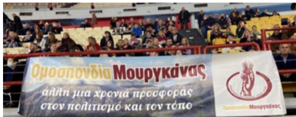
Το πανό της Ομοσπονδίας Μουργκάνας στην εκδήλωση της «Πίτας του Ηπειρώτη 2023»

Ομόφωνα εγκρίθηκαν ο Διοικητικός και Οικονομικός απολογισμός του απερχόμενου Διοικητικού Συμβουλίου της Ομοσπονδίας Μουργκάνας στη συνέλευση που έγινε στις 18 Δεκεμβρίου 2022 στα γραφεία της Ομοσπονδίας. Στη συνέλευση πήραν μέρος 38 Αντιπρόσωποι από 12 Αδελφότητες και τη διεύθυνση των εργασιών ανέλαβε ο Γιώργος Οικονόμου, πρώην πρόεδρος του Δ.Σ. της Πανηπειρωτικής Συνομοσπονδίας Ελλάδας (Π.Σ.Ε.).