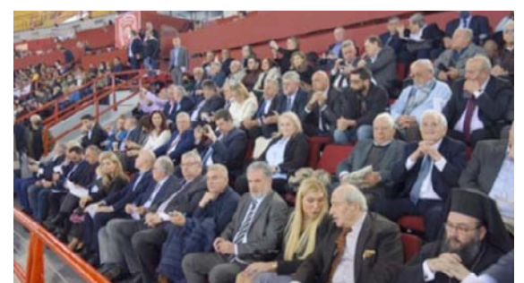
Η εξέδρα των επισήμων

Σας ευχαριστώ θερμά για την συμμετοχή σας στη σημερινή μεγαλειώδη γιορτή μας και εύχομαι σε όλους, ιδιαίτερα δε στην Ηπειρώτισσα γυναίκα, υγεία, προκοπή, τύχη, καλή, δημιουργική και ειρηνική χρονιά.