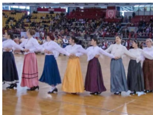
Ομάδα παραδοσιακών χορών Δ. Νίκαιας - Αγ. Ι. Ρέντι