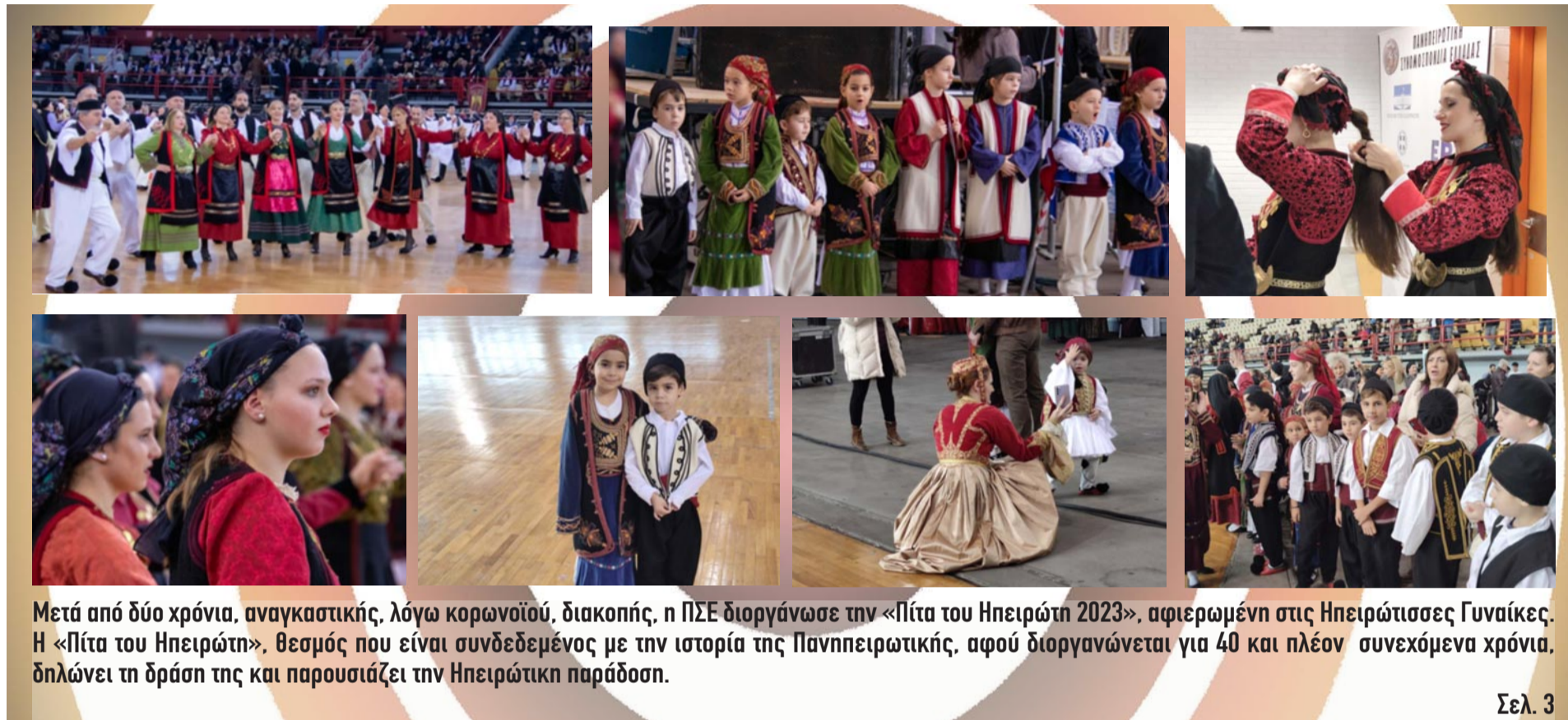
Μετά από δύο χρόνια, αναγκαστικής, λόγω κορωνοϊού, διακοπής, η ΠΣΕ διοργάνωσε την «Πίτα του Ηπειρώτη 2023», αφιερωμένη στις Ηπειρώτισσες Γυναίκες. Η «Πίτα του Ηπειρώτη», θεσμός που είναι συνδεδεμένος με την ιστορία της Πανηπειρωτικής, αφού διοργανώνεται για 40 και πλέον συνεχόμενα χρόνια, δηλώνει τη δράση της και παρουσιάζει την Ηπειρώτικη παράδοση.