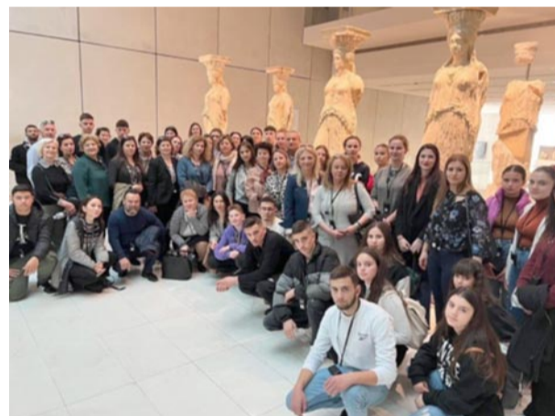
Από την ξενάγηση στο Μουσείο της Ακρόπολης