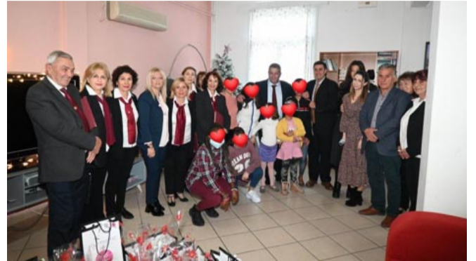
Από την επίσκεψη στη «Στέγη Θηλέων Π. Φάληρο-Άγιος Αλέξανδρος»