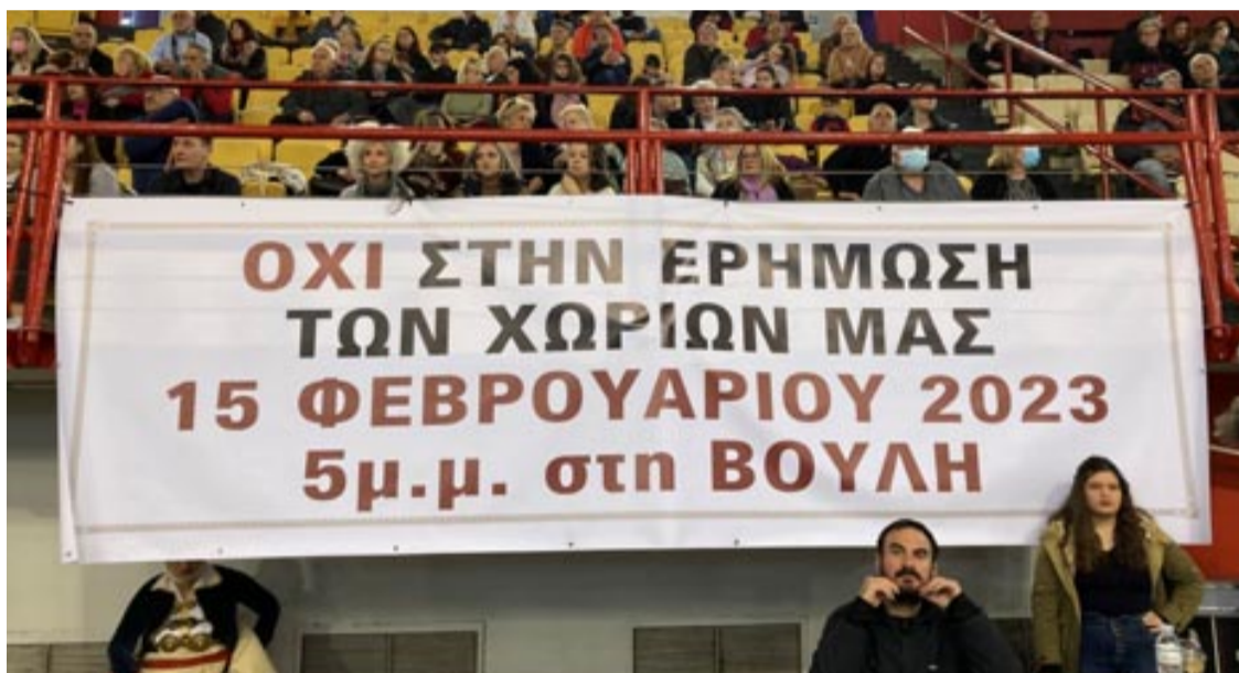
Πανό στην εκδήλωση για την «Πίτα του Ηπειρώτη 2023»