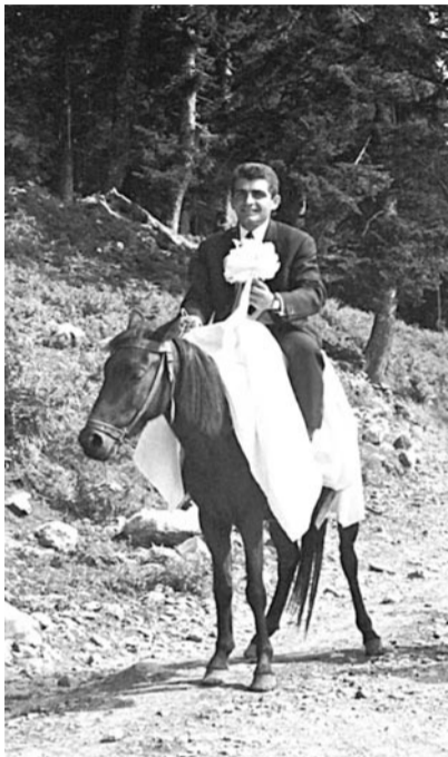
1969. Συχαρικιάρης σε γάμο στην Κυψέλη Άρτας.