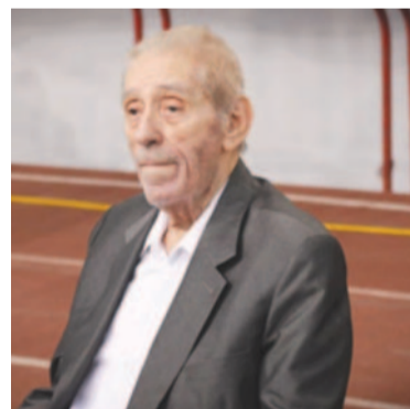
Η τελευταία φωτογραφία στο ΣΕΦ στην «Πίτα του Ηπειρώτη 2019», 3 Φεβρουαρίου 2019