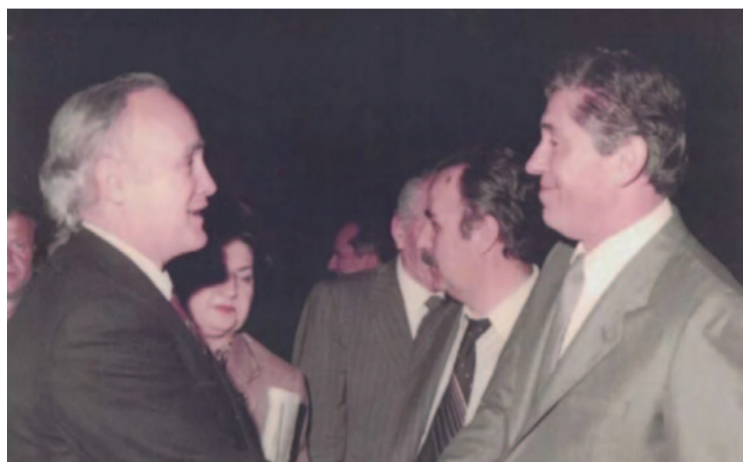
Σε εκδήλωση με τον Κάρολο Παπούλια