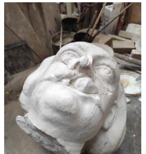
Τα κατορθώματα-αποτυπωμένα-των βανδάλων