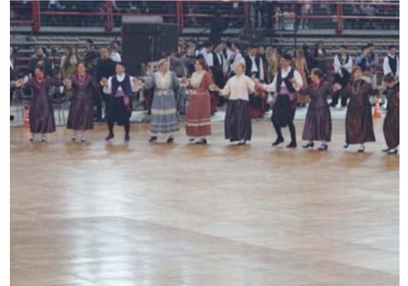
Πολιτιστικός Σύλλογος Αγίας Παρασκευής «Χοροταξιδευτές»