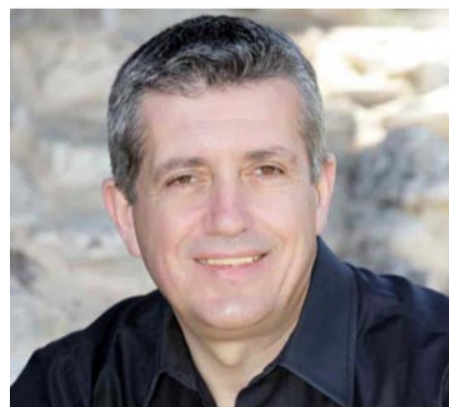
Ο Δήμαρχος Βορείων Τζουμέρκων, Γιάννης Σεντελής

Εγώ προσωπικά ως αιρετός που διανύω τον 9ο χρόνο στην τοπική αυτοδιοίκηση σήμερα απογοητευτικά πλήρως.