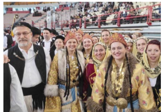
Τα μέλη του Συλλόγου Μικρασιατών Ελευσίνας