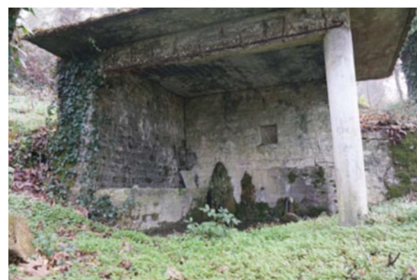
«Οι βρύσες ακόμα τρέχουν»