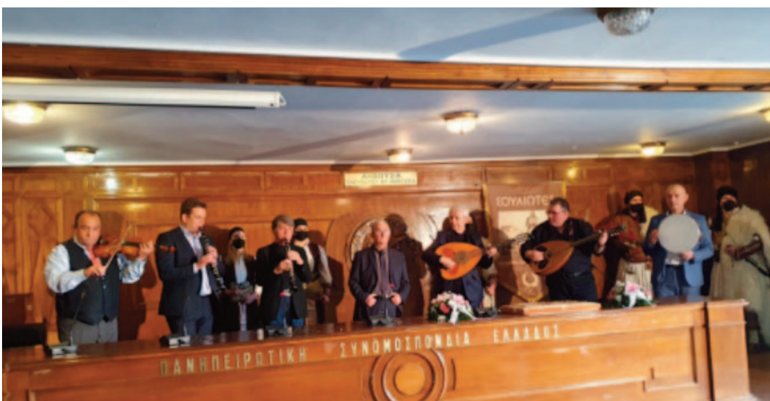
Πίτα του Ηπειρώτη 2022

Η ΠΣΕ κατάφερε, παρά τις δυσκολίες και τους περιορισμούς της πανδημίας, να κινητοποιήσει ένα σημαντικό δυναμικό των τεχνών και των γραμμάτων απ' την Ήπειρο και να παρουσιάσει στο ευρύτερο κοινό τις δημιουργίες τους. Το δια ζώσης Πολυαφιέρωμα συμπεριλάμβανε ένα πολύ-