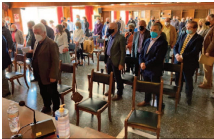
Η μνήμη για όλους τους Ηπειρώτες/σες για όσους/ες «έφυγαν» είναι «άκαυτη βιάς»