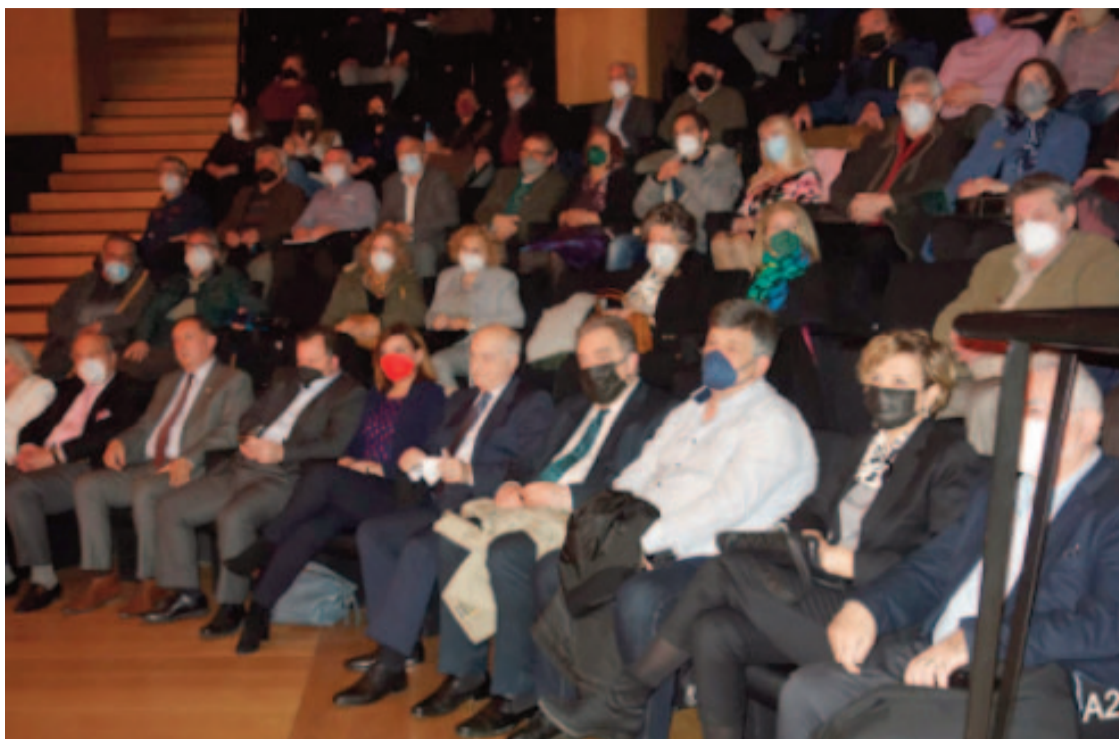
Από την τελετή έναρξης 23.2.2022 του Πολυαφιερώματος στο Αμφιθέατρο Μιλτιάδη Έβερτ