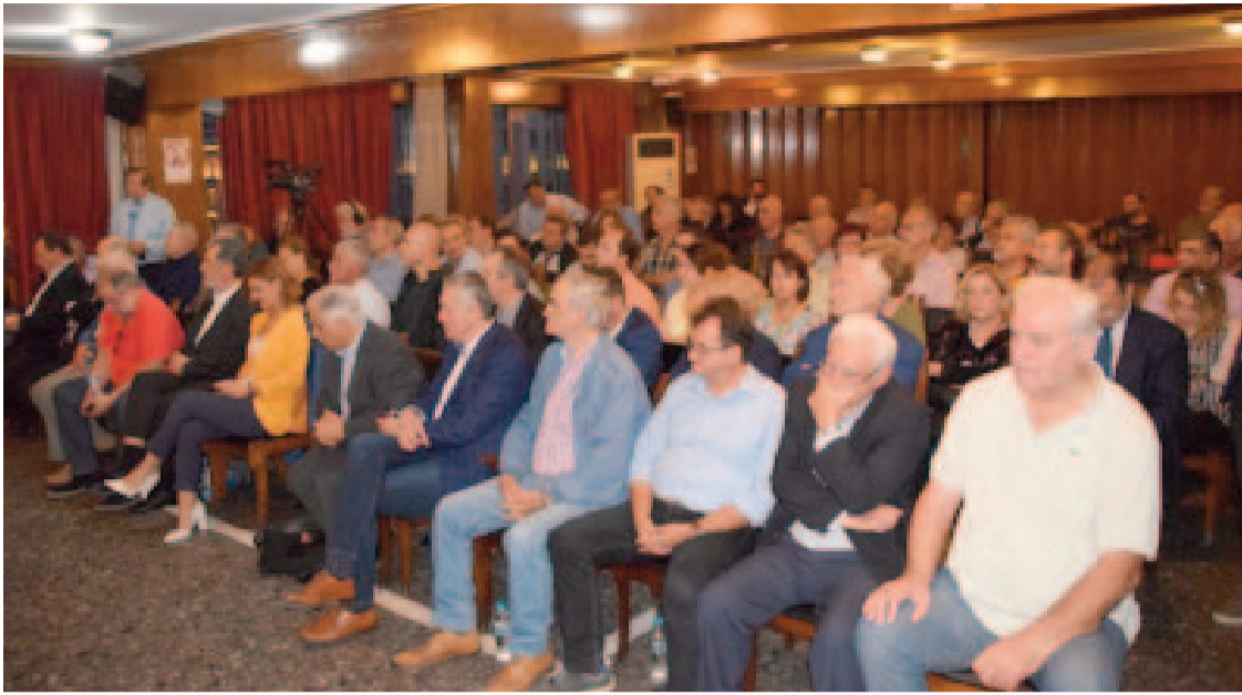
Από τη σύγκληση του Διευρυμένου Γενικού Συμβουλίου των προέδρων των σωματείων μας, προκειμένου να οργανώσουν τον αγώνα για τα Εθνικά Κληροδοτήματα στις 23.10.2019