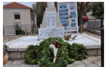
Το μνημείο των εκτελεσθέντων στην Κρουπηγή Πρεβέζης

Η ΠΣΕ αγωνίζεται για τη δικαίωση των θυμάτων και την αληθινή αποκατάστασή τους. Χρέος τιμής".