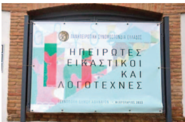
Για έξι μέρες, απ' τις 23 -28 Φεβρουαρίου 2022, η καρδιά της Ηπειρωτικής αποδημίας χτύπησε στο Γκάζι, στην "Τεχνόπολη" του Δήμου Αθηναίων