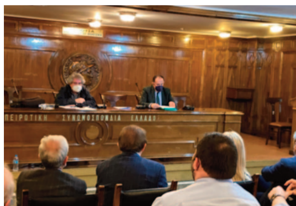
Από τη συνεδρίαση 15.4.2022 του νεοεκλεγέντος ΔΣ της Πανηπειρωτικής Συνομοσπονδίας Ελλάδας