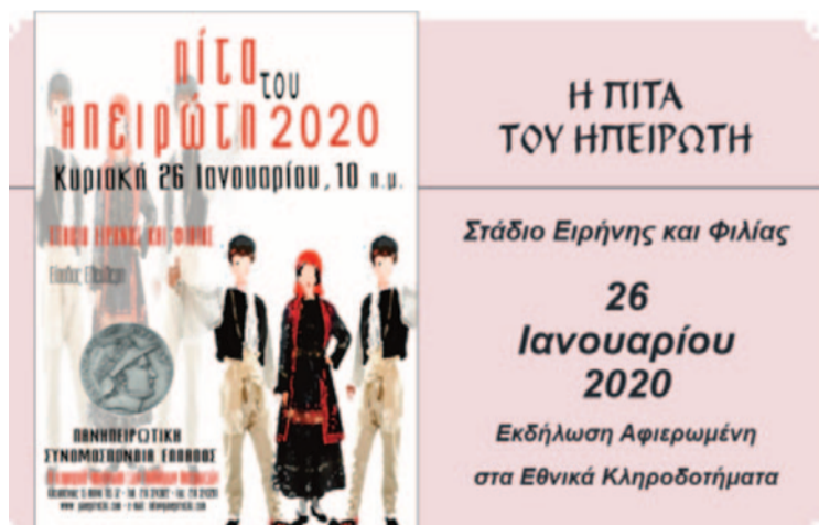
Η «Πίτα του Ηπειρώτη», ένας θεσμός ταυτισμένος με την ΠΣΕ

Η επέλαση της πανδημίας, η τήρηση των προβλεπόμενων μέτρων κοινωνικής αποστασιοποίησης, η πολύμηνη αναστολή της δράσης επηρέασαν καθοριστικά την συνέχεια της πολιτιστικής δράσης της ΠΣΕ. Στις πρωτόγνωρες, αυτές, συνθήκες, με την ανάγκη προστασίας της δημόσιας υγείας να ηρτάνεται, μια σειρά προγραμματισμένες δράσεις ή εκδηλώσεις ματαιώθηκαν. Η Πολιτιστική Επιτροπή, με την στήριξη του ΔΣ, κινήθηκε προς την προσαρμογή της πολιτιστικής δράσης στις νέες συνθήκες, με τρόπους που θα αντιπερικόνηται, κατά το δυνατό, το αποτρεπτικό περιβάλλον. Ως προνομιακό πεδίο ανάπτυξης δράσης, σε αυτή την κατεύθυνση, προκρίθηκε