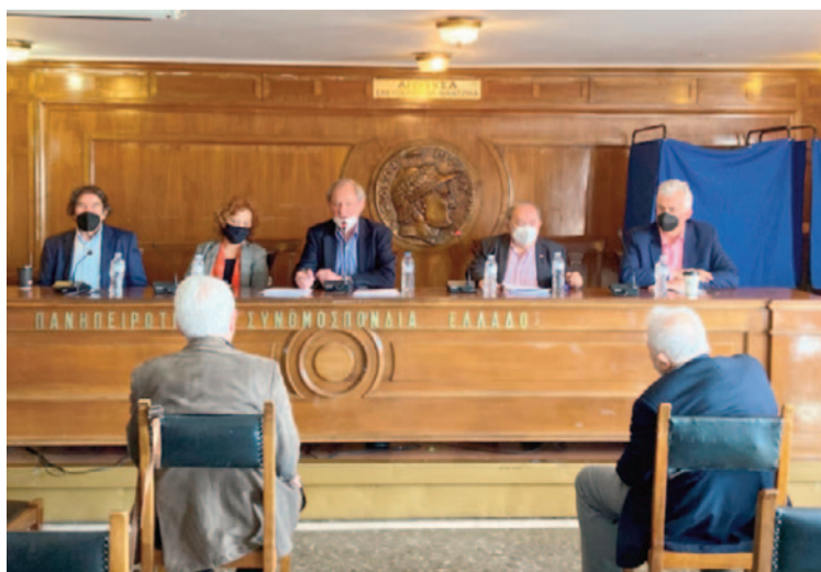
Το προεδρείο της Γενικής Συνέλευσης 10.4.2022