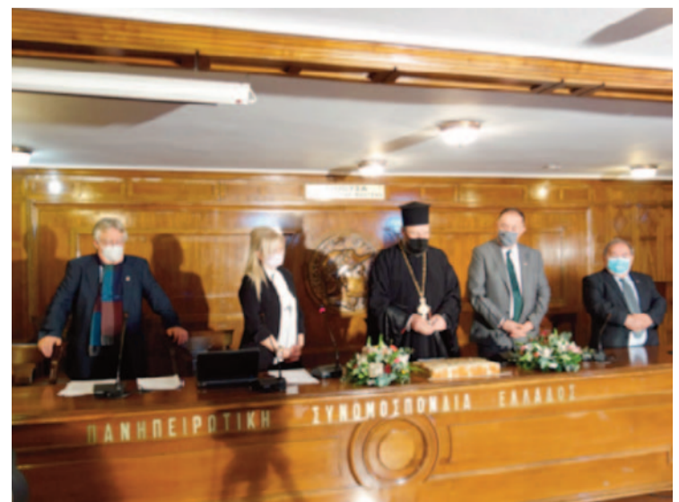
Η «Πίτα του Ηπειρώτη 2021» στα γραφεία της ΠΣΕ με διαδικτυακή συμμετοχή