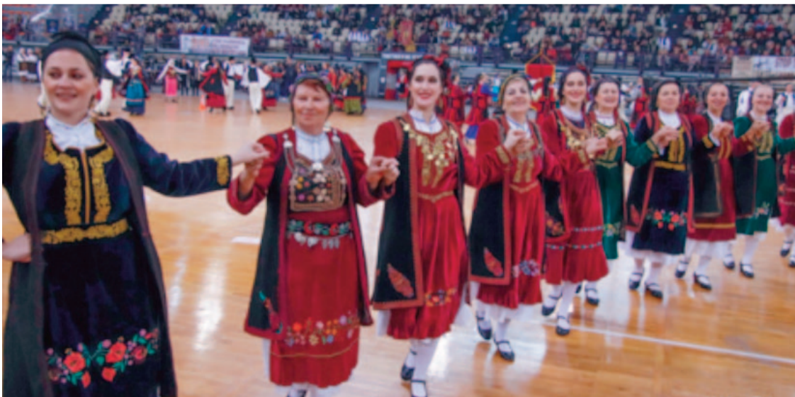
«Η Πίτα του Ηπειρώτη» ένας θεσμός 40 και πλέον χρόνων