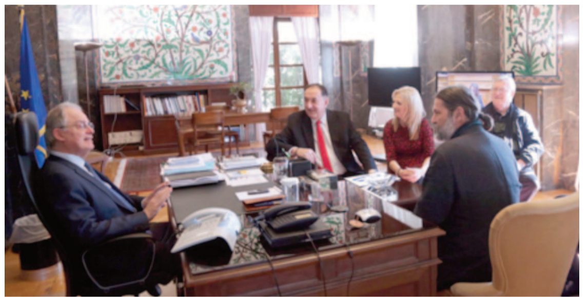
28.1.2020. Από την επίσκεψη αντιπροσωπείας της ΠΣΕ στον Πρόεδρο της Βουλής Κώστα Τασούλα

Το ΔΣ της ΠΣΕ που ανέλαβε τη διοίκηση της την 1η Απριλίου 2019 βρέθηκε μπροστά σε πολλά και δυσεπίλυτα προβλήματα. Λίγο πριν, στην εκλογολογιστική Γενική συνέλευση είχε καταψηφιστεί ο διοικητικός και οικονομικός απολογισμός καθώς και οι προτάσεις προγραμματισμού και προϋπολογισμού της προηγούμενης διοίκησης. Στο ταμείο, όπως διαπιστώθηκε στην πορεία, δεν είχαν καταγραφεί κάποιες οφειλές, με αποτέλεσμα να υπάρχει ένα κενό το οποίο στην πορεία το τακτοποιήσαμε. Η έλλειψη της επικοινωνίας με τα μέλη ήταν φανερή. Προς αυτή την κατεύθυνση προσπαθήσαμε και προσπαθούμε να έχουμε επαφή και επικοινωνία με όλα τα μέλη μας. Η εκπροσώπηση της Πανηπειρωτικής σε εκδηλώσεις, γιορτές, ομιλίες κλπ. που διοργανώνουν οι σύλλογοι μας και προσκαλούν την ΠΣΕ είναι σταθερή, και