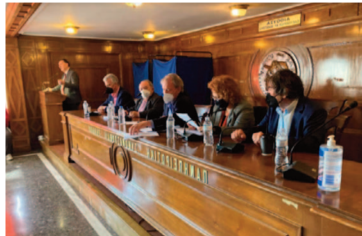
Η Γενική Συνέλευση διεξήχθη σύμφωνα και με απόλυτο σεβασμό στα υγειονομικά πρωτόκολλα

Η στηριγμένη με επιστημονικά κριτήρια τοποθέτηση της ΠΣΕ στα μεγάλα προβλήματα της Ηπείρου και των Ηπειρωτών της αποδημίας βρίσκεται συνεχώς στην προτεραιότητα μας. Εκφράστηκε στη συμμετοχή μας στα περιφερειακά συμβούλια, στις συνεδριάσεις των δημοτικών συμβουλίων, στις ανακοινώσεις μας για τον ενεργειακό σχεδιασμό, την δια-