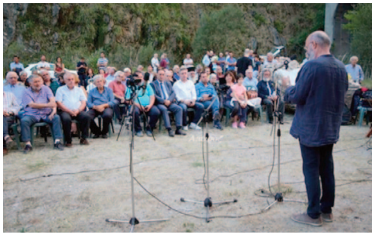
30 Ιουλίου 2019 στη γέφυρα Κοράκου

τα μέλη της. Η εκδήλωση διοργανώθηκε με την ενεργό συμμετοχή της οικογένειας του αείμνηστου Σταύρου Καψάλη καθώς και των μουσικών συνεργατών του. Συμμετείχαν εθελοντικά οι κορυφαίοι δεξιότεχνες και ερμηνευτές Πετρολούκας Χαλικιάς, Ναπολέον Δάμου, Σάββας Σιάτρας, Παγώνα Αθανασίου, Γιάννης Καψάλης κ.ά. Στο κάλεσμα της εκδήλωσης ανταποκρίθηκαν περισσότεροι από δύο χιλιάδες θεατές ζώντας μια σιμόσφαιρα κατάνυξης και σεβασμού, αποδίδοντας την πρέπουσα τιμή στην μνήμη του αξέχαστου Σταύρου Καψάλη.