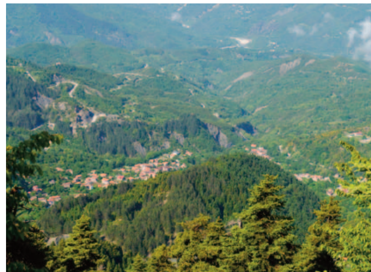
Σε όλους τους τόνους η ΠΣΕ ύψωσε τη φωνή: «Αφήστε αυτόν τον όμορφο κόσμο να διασωθεί. Ανακινώντας το αύριο μες στις πηγές του»

Το Γενικό Συμβούλιο πραγματοποιήθηκε υβριδικά με φυσική παρουσία και διαδικτυακά με πολύ μεγάλη συμμετοχή. Παρουσιάστηκε η πρόταση του ΔΣ για τον Ενεργειακό Σχεδιασμό και τοποθετήθηκαν Ομοσπονδίες, Αδελφότη-