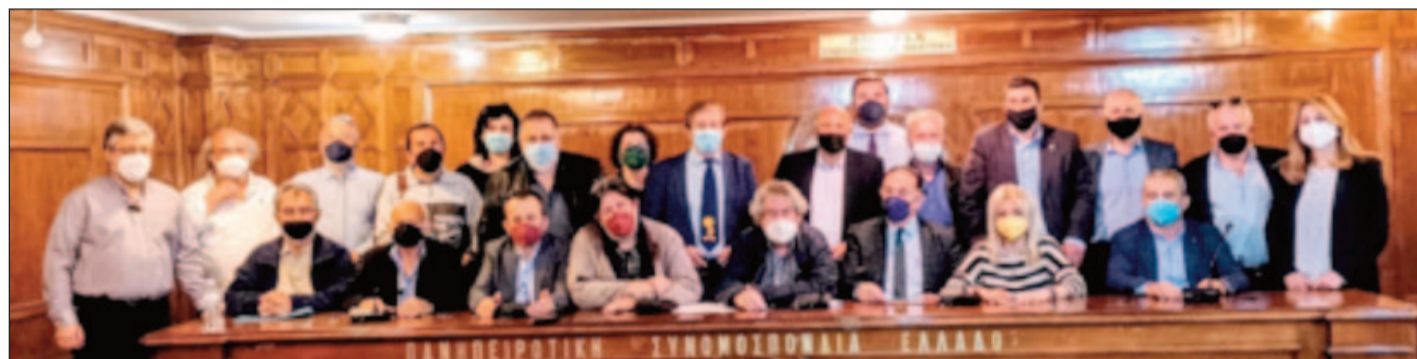
Το νέο Διοικητικό Συμβούλιο της Πανηπειρωτικής Συνομοσπονδίας Ελλάδας

Μ ε απόλυτη επιτυχία πραγματοποιήθηκε η Γενική Συνέλευση των αντιπροσώπων της ΠΣΕ την Κυριακή 10 Απριλίου 2022. Έλαβαν μέρος 90 Ηπειρώτικα Σωματεία της Αποδημίας, από τα 174 ταμειακά εντάξει, επί συνόλου 198 νομιμοποιηθέντων σωματείων.