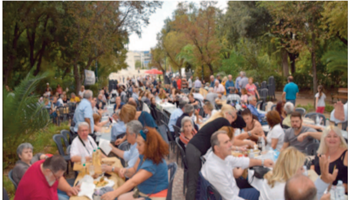
6 Οκτωβρίου 2019. Μεγάλο Ηπειρωτικό πανηγύρι στο Πεδίο του Άρεως