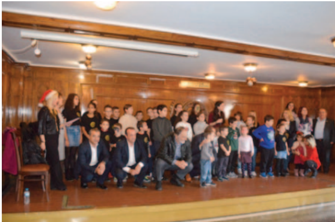
15 Δεκεμβρίου 2019. Παιδική γιορτή για τα Ηπειρωτόπουλα

Το μεγάλο αυτό θέμα που αγγίζει την ίδια την ύπαρξη της οργανωμένης Ηπει-