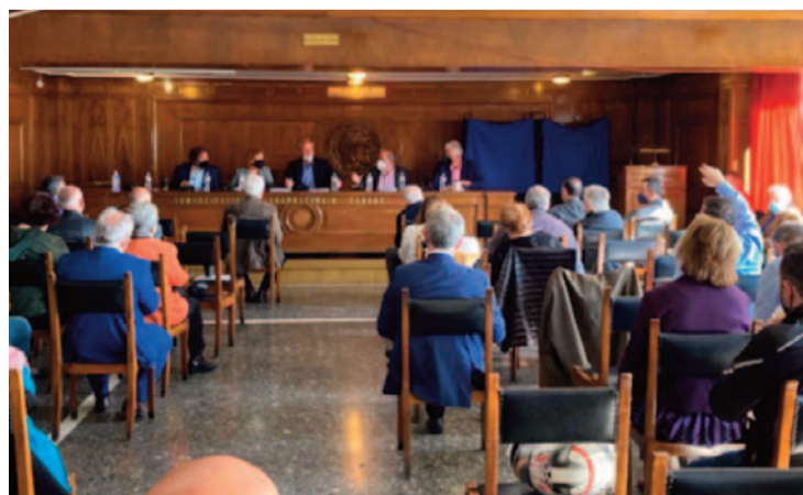
Η συμμετοχή, παρά τα υγειονομικά μέτρα, ήταν χαρακτηριστική